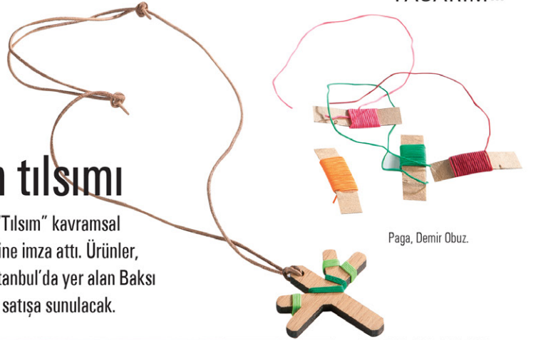
Paga, Demir Obuz.