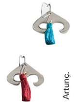
Yapım Nüfuz Artunc.