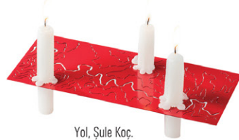
Yol, Şule Koç.