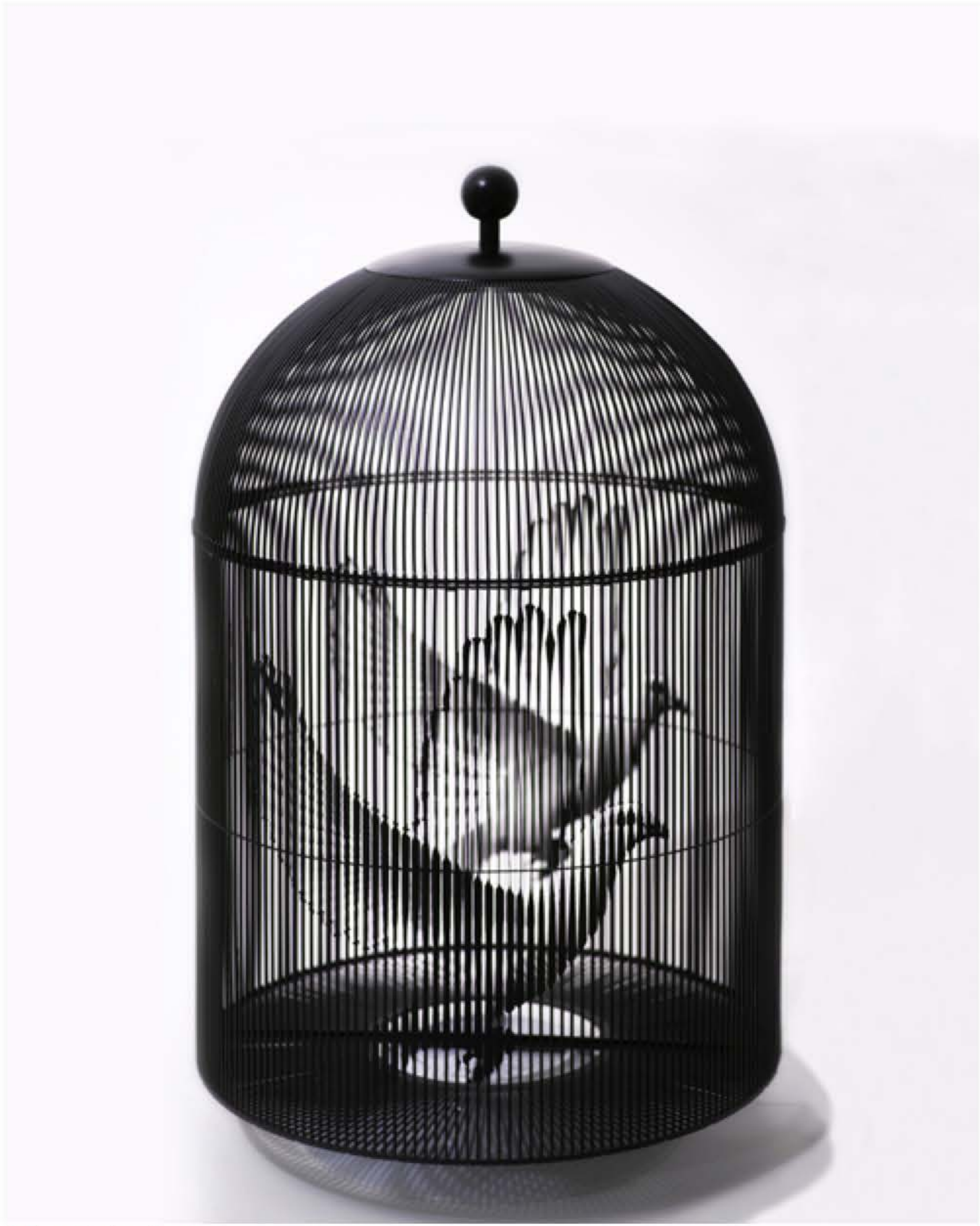
Aykut Erol - Sınırsız