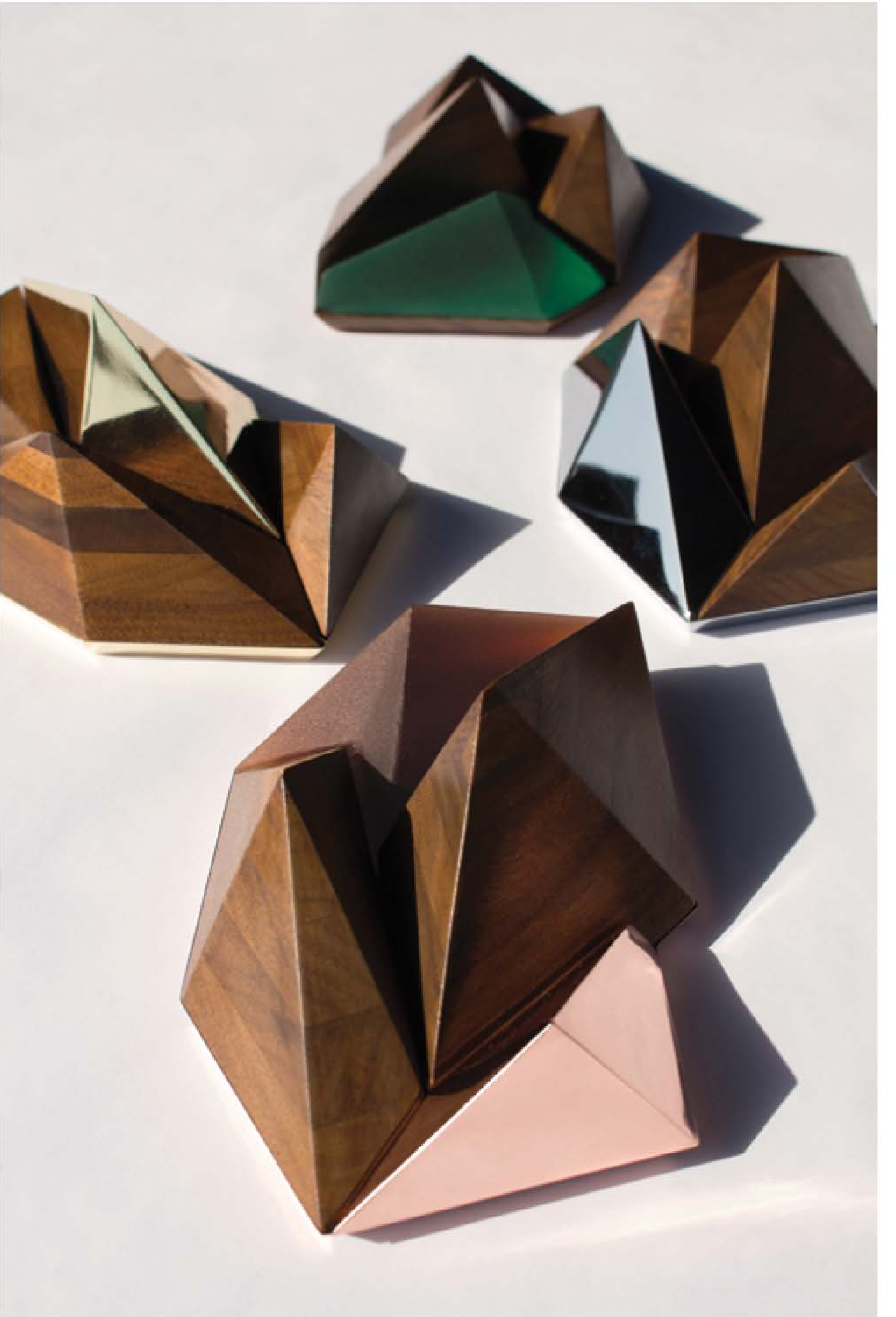
Demirden Design - Yüzleşme